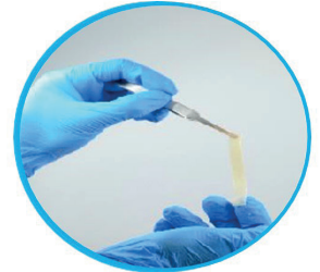
Elastisitet og forlengelse