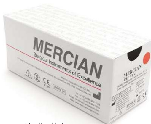
Sterilt pakket Eske à 12 stk.

Begge sidene av mattene kan brukes. De har begge en matt anti-refleks overflate som eliminerer gjenskinn fra belysningen i operasjonssalen. Den ene siden har et rutenett med 1mm ruter, som brukes til måling. Mattene har en overflate som ikke klitrer seg fast til karene som skal sys sammen.