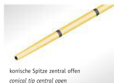
konische Spitze zentral offen conical tip central open