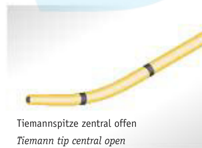
Tiemannspitze zentral offen Tiemann tip central open