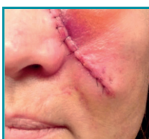
3 dager etter operasjon