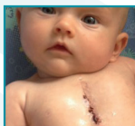
2 uker etter operasjon