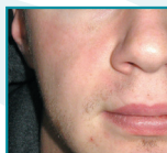
Etter 4 måneder med NewGel+