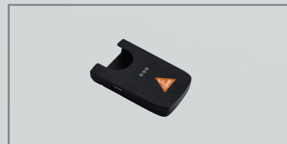
CC1 ladeetui [02]